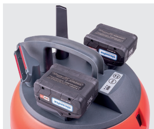
Batteries, commande et accessoires standard