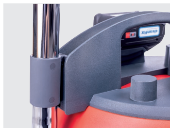
Support pour le tube d'aspiration