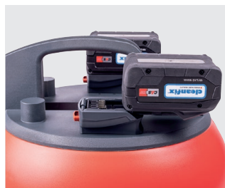
Montage/démontage facile des batteries