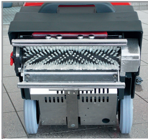
Vue du dessous