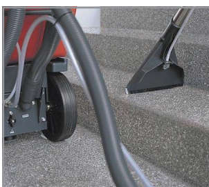
Nettoyage des escaliers (en option)