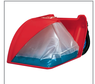
Section de cuve