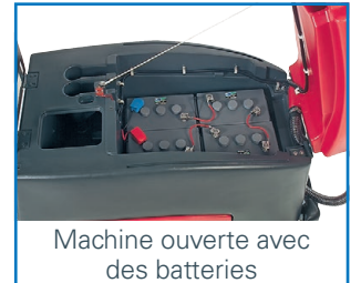
Machine ouverte avec des batteries