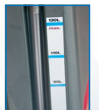
Indication niveau eau propre