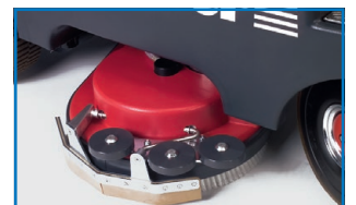
La tête de brosse pivotante permet de nettoyer près du bord