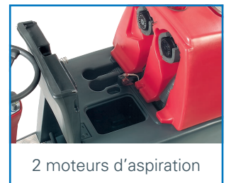
2 moteurs d'aspiration