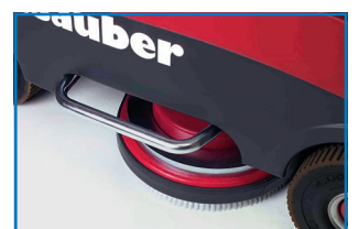
Arceau de protection stable