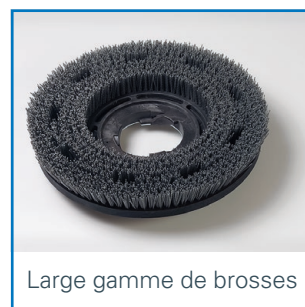
Large gamme de brosses