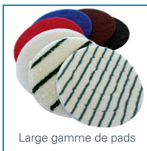
Large gamme de pads