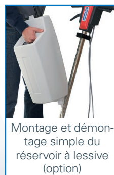
Montage et démontage simple du réservoir à lessive (option)