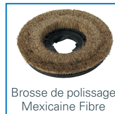
Brosse de polissage Mexicaine Fibre