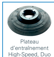
Plateau d'entraînement High-Speed, Duo