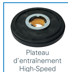
Plateau d'entraînement High-Speed