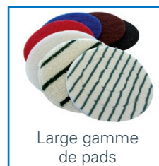
Large gamme de pads