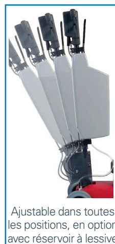
Ajustable dans toutes les positions, en option avec réservoir à lessive