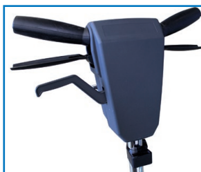
Poignée robuste pour une utilisation intensive