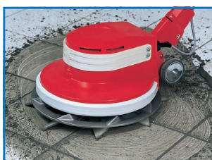
Jointoyer le carrelage