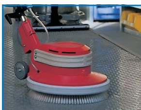
Nettoyage du fond bombé