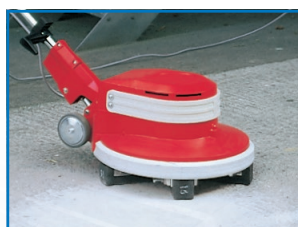
Meuler du béton/coulis de ciment