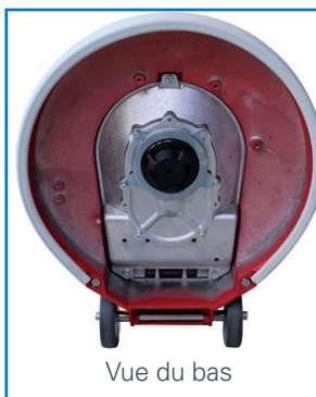
Vue du bas