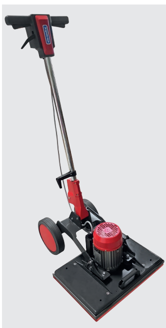
E50x35 Excenter Contenu de la livraison

Leur conception carrée leur permet de s'intégrer parfaitement dans n'importe quel coin. Le réglage breveté de la poignée et les grandes roues pour un transport facile sont de grands avantages. Les deux goupilles d'arrêt (750.586 Kit de goupilles d'arrêt) situées sur le corps sont également utiles. Elles permettent de 1. soulever les roues du sol pour ne pas laisser de traces de roulement ou 2. de retourner complètement le timon pour obtenir un poids maximum sur le sol. Vous pouvez adapter parfaitement le poids de la machine à votre application en ajoutant des poids supplémentaires. Il suffit de régler la tête de brosse de l'Excenter E44 et vous pouvez facilement changer les disques ou ranger la machine.