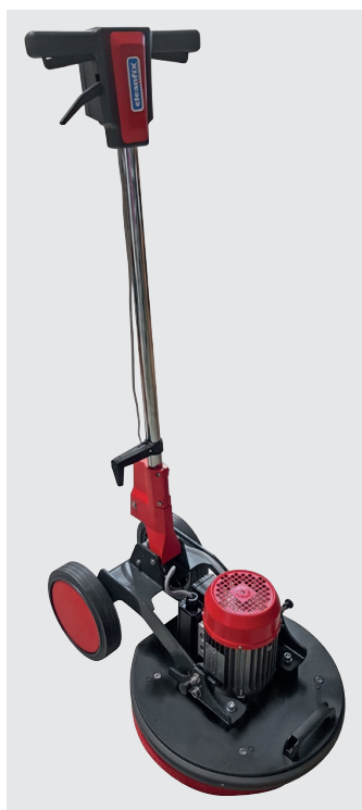
E44 Excenter Contenu de la livraison

Le réglage breveté de la poignée et les grandes roues pour un transport facile sont de grands avantages. Les deux goupilles d'arrêt (750.586 Kit de goupilles d'arrêt) situées sur le corps sont également utiles. Elles permettent de 1. soulever les roues du sol pour ne pas laisser de traces de roulement ou 2. de retourner complètement le timon pour obtenir un poids maximum sur le sol. Vous pouvez adapter parfaitement le poids de la machine à votre application en ajoutant des poids supplémentaires. Il suffit de régler la tête de brosse de l'Excenter E44 et vous pouvez facilement changer les disques ou ranger la machine.